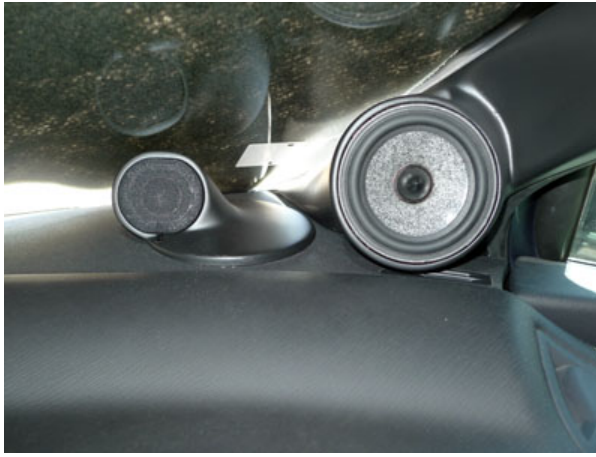
La C4 de Franck s'est encore affinée et présente une écoute époustouflante

Franck avait encore amélioré sa C4, avec un montage remarquable des médiums et des tweeters Utopia. L'écoute était vraiment époustouflante de réalisme. Bien sûr, on n'a pas pu écouter toutes les voitures, puisqu'il fallait bien faire les photos, mais celles que j'ai écoutées, m'ont régalé les oreilles. Focal présentait une DS3 avec une intégration de haut-parleurs Focal, deux amplificateurs et un processeur Focal. Le but était de montrer que l'on pouvait faire une installation bien intégrée, avec peu de modification, et ce tout en conservant la source d'origine. Il y a certes un assez gros travail sur la voiture, mais pour avoir tester dans nos colonnes l'installation d'origine de la DS3, c'était le jour et la nuit ! Et puis la DS3 est une voiture tendance, une voiture passion, bref un excellent choix pour véhiculer notre passion de la musique en voiture auprès du grand public. Difficile de parler de toutes les voitures dans un seul article résumant le week-end, car il y avait tellement de belles choses à voir, mais une grosse galerie photo vous permettra de tout découvrir et de trouver des idées, si vous êtes en pleine réalisation d'une installation.