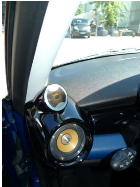
Une belle intégration de kit 3 voies dans cette Mini

Comme l'an dernier, le lundi matin, Focal accueillait les participants autour d'un petit déjeuner avant d'attaquer la visite de l'usine et l'écoute des grandes Utopia BE (enceintes de salon entrées dans la légende de la haute fidélité). Pour ceux qui n'ont jamais visité l'usine, c'est toujours un grand moment, car ils peuvent découvrir comment on fabrique les haut-parleurs, la technologie et la recherche que l'on ne voit pas sur le produit fini, ... Un très bon moyen de montrer aux consommateurs, pourquoi un haut-parleur de qualité coûte un certain prix. Car ce n'est pas une visite au pas de course, Focal organise plusieurs groupes afin de pouvoir répondre à toutes les questions et bien expliquer le son aux visiteurs.