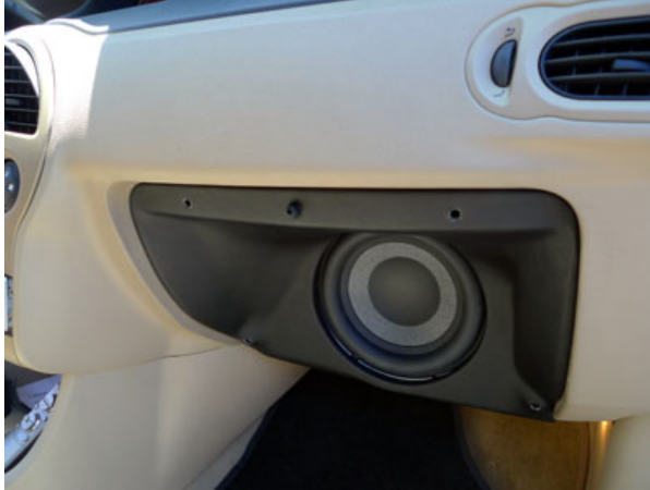
Intégration d'un sub dans la boîte à gants d'une Modus pour un grave bien à l'avant

En matière de tuning, deux voitures ont particulièrement retenu notre attention. Loic est revenu avec une nouvelle Polo tractant une Polo coupé en remorque. Le travail réalisé sur la voiture est titanesque. On a aussi beaucoup aimé la Renault Mégane traitée mi-old School, mirat, qui présentait un souci du détail époustouflant (sub dans une vieille valise, garniture en toile de jute, vieille télé en bakélite dans le coffre, ...). Bravo à ses réalisateurs, car c'est vraiment très original et très bien fait ! Une très belle Chrysler 300 break avec écran LCD et PS2 dans le coffre méritait également le détour. Que ce soit en catégorie pro ou débutant, on note une réelle montée en qualité, en recherche de montage et d'intégration. Une belle Mini présentait une très belle intégration de tweeters et de médiums dans la planche de bord et dans les montants de pare-brise. Signalons également le retour d'une grande figure des concours automobiles, avec Bruno Granger qui présentait une Renault Modus avec une superbe intégration de l'installation pour conserver la fonctionnalité de la voiture. Pour avoir un grave bien à l'avant et laisser le coffre vide, le subwoofer était logé dans la boîte à gants. Un gros travail avait aussi été fait sur les garnitures de porte pour intégrer les woofers.