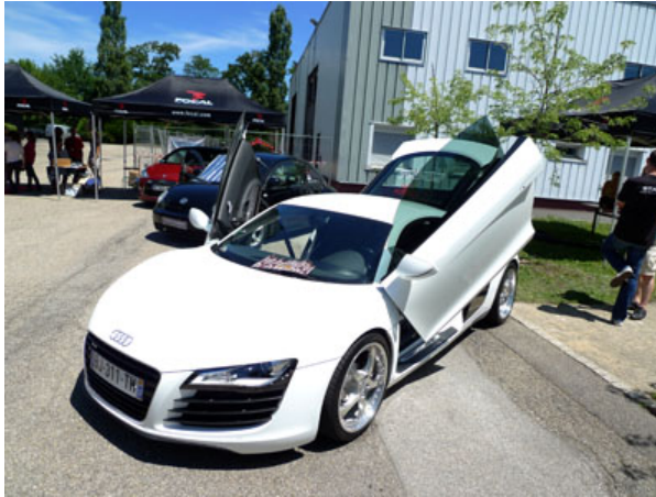
Audi R8, Ferrari 512 TR, il y avait de beaux bolides avec installation hi-fi

Franck avait encore amélioré sa C4, avec un montage remarquable des médiums et des tweeters Utopia. L'écoute était vraiment époustouflante de réalisme. Bien sûr, on n'a pas pu écouter toutes les voitures, puisqu'il fallait bien faire les photos, mais celles que j'ai écoutées, m'ont régalé les oreilles. Focal présentait une DS3 avec une intégration de haut-parleurs Focal, deux amplificateurs et un processeur Focal. Le but était de montrer que l'on pouvait faire une installation bien intégrée, avec peu de modification, et ce tout en conservant la source d'origine. Il y a certes un assez gros travail sur la voiture, mais pour avoir tester dans nos colonnes l'installation d'origine de la DS3, c'était le jour et la nuit ! Et puis la DS3 est une voiture tendance, une voiture passion, bref un excellent choix pour véhiculer notre passion de la musique en voiture auprès du grand public. Difficile de parler de toutes les voitures dans un seul article résumant le week-end, car il y avait tellement de belles choses à voir, mais une grosse galerie photo vous permettra de tout découvrir et de trouver des idées, si vous êtes en pleine réalisation d'une installation.