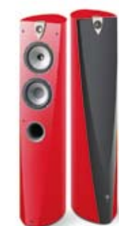
> Profile 918, Imperial Red.

Version compacte du SW 908, le Profile SW 904 reprend néanmoins la même structure, avec DSP mais avec un woofer de 27 cm. Il sera adapté partout où les niveaux de puissance sonore très élevés du SW 908 ne seront pas nécessaires.