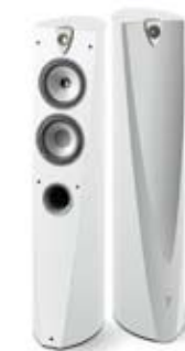
> Profile 918, Diamond White.

Les finitions Imperial Red et Diamond White seront disponibles au second semestre 2009 selon pays et réseaux de distribution.